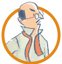
IL SIGNOR DARLING Il papà di Wendy, Gianni e Michele