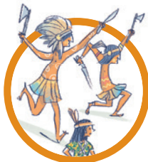
I BAMBINI SMARRITI, I PIRATI E I PELLEROSSA Gli abitanti dell'Isola che non c'è