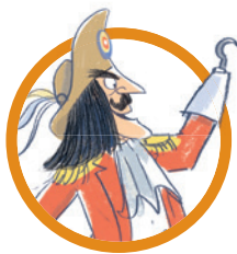
CAPITAN UNCINO Il terribile pirata avversario di Peter Pan