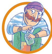
SPUGNA Il pirata aiutante di Capitan Uncino