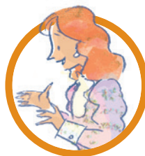
LA SIGNORA DARLING La mamma affettuosa dei tre fratellini