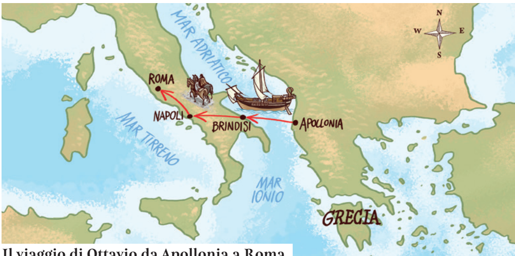
Il viaggio di Ottavio da Apollonia a Roma.

E invece sarà proprio lui a diventare il nuovo signore di Roma, col nome di Caio Giulio Cesare Ottaviano .