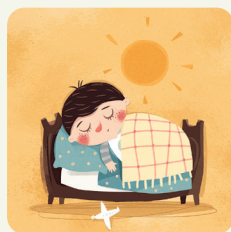
Faccio un riposino