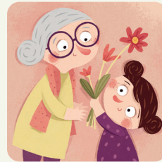
Festa della nonna