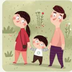
Passeggio con i miei genitori