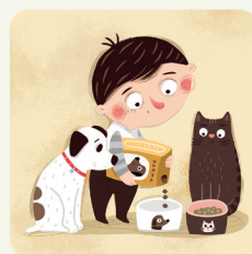
Do da mangiare agli animali