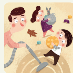
Aiuto con le pulizie in casa