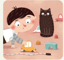
Gioco in casa