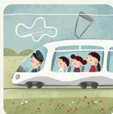
Vado in treno