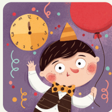
Vado alla festa di Capodanno