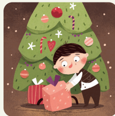
Apri i regali di Natale