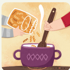
Aiuto a cucinare / I genitori cucinano, io gioco