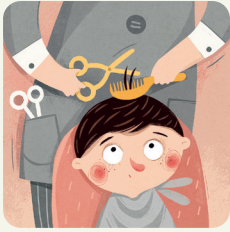
Vado dal parrucchiere/ dalla parrucchiera