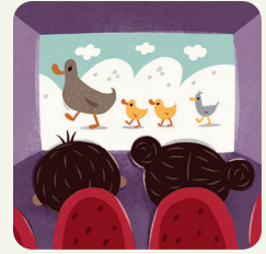
Vado al cinema