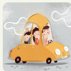
Vado in auto