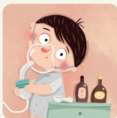
Prendo le medicine, faccio l'aerosol