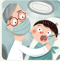
Vado dal/dalla dentista