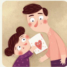
Festa del papà