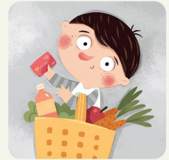
Faccio la spesa