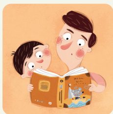
Leggo un libro