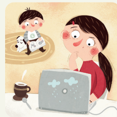
La mamma lavora, io gioco