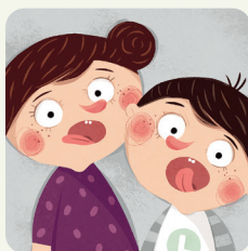
Faccio gli esercizi di logopedia