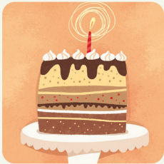
Festeggio il compleanno