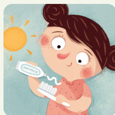
Mi lavo i denti