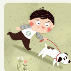
Porto il cane a passeggio