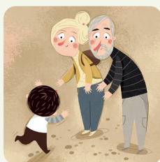
Vado a trovare i nonni