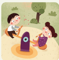
Vado al parco giochi