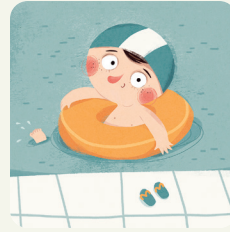
Vado in piscina