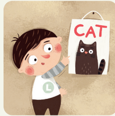
Imparo una lingua straniera