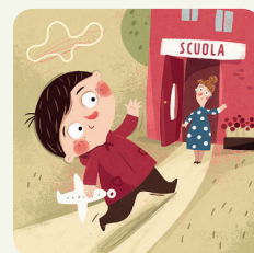
Vado alla scuola dell'infanzia