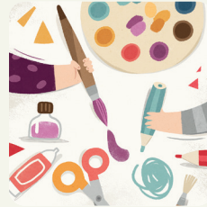
Dipingo, disegno, ritaglio