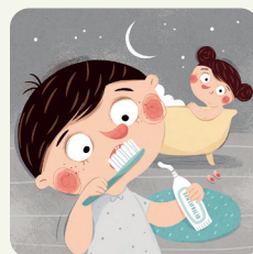
Mi lavo i denti, faccio il bagno o la doccia