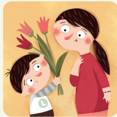
Festa della mamma