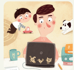
Il papà lavora, io gioco