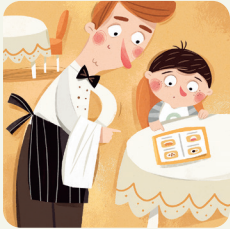
Vado al ristorante