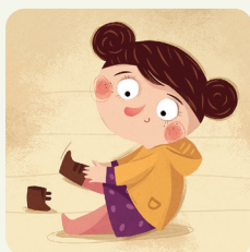
Mi vesto prima di uscire