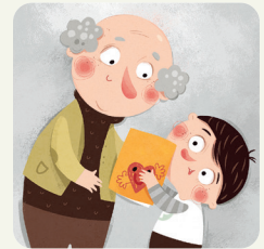
Festa del nonno