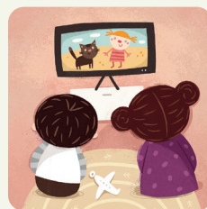
Guardo la TV