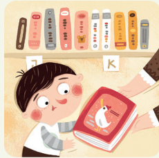
Vado in biblioteca