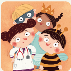
Vado a una festa in maschera