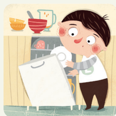
Aiuto a sparecchiare e riordinare dopo i pasti