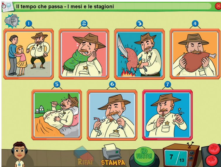
Fig. 6 Videata 7 della sezione 4. Il tempo che passa - I mesi e le stagioni.