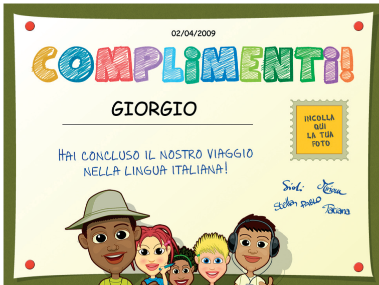
Fig. 4 L'attestato finale.