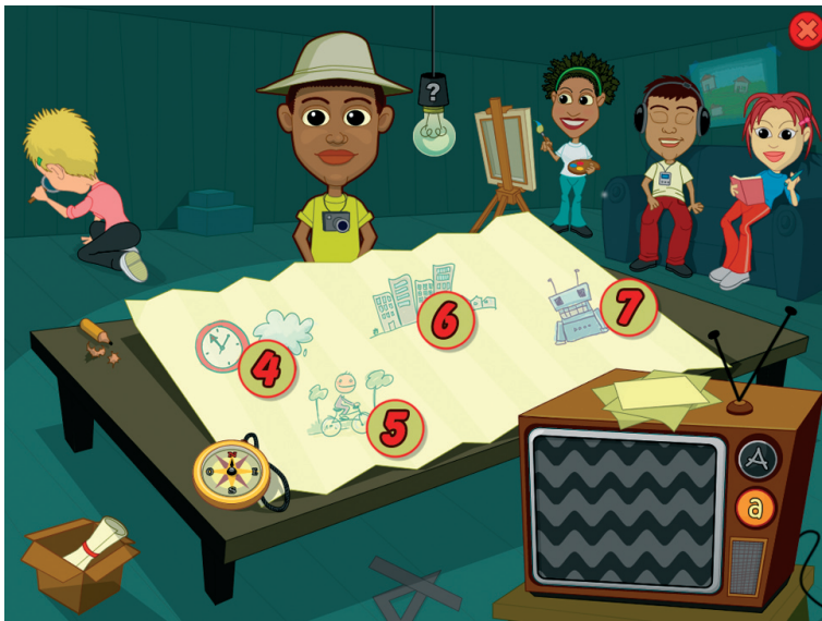
Fig. 2 Videata del Menu con le sezioni principali.