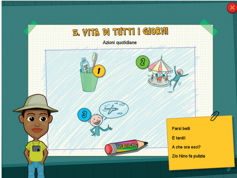
Fig. 7 Il menu della quinta sezione con le iconcine delle 4 unità.