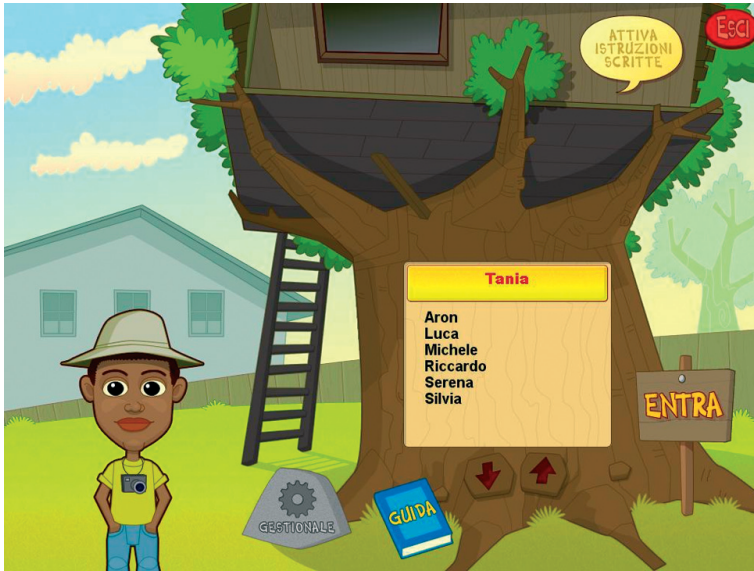
Fig. 1 Videata del Login dove l'utente si registra.