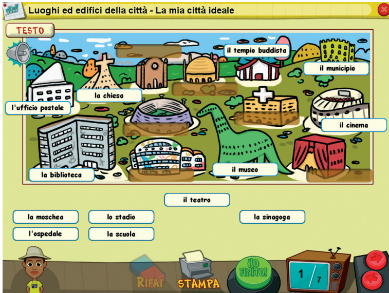
Fig. 10 Videata 1 della sezione 6. Luoghi ed edifici della città - La mia città ideale.