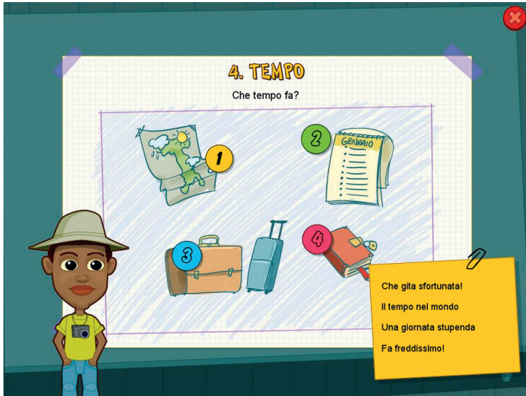
Fig. 5 Il menu della quarta sezione con le iconcine delle 4 unità.