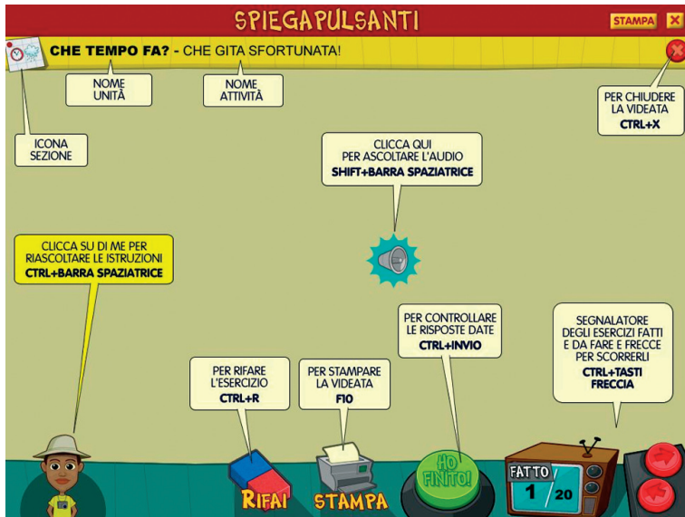
Fig. 3 Videata dello Spiegapulsanti.