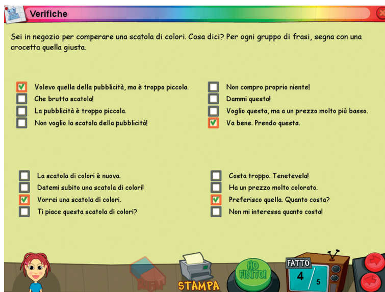
Fig. 12 Videata 4 della sezione 7. Verifiche.