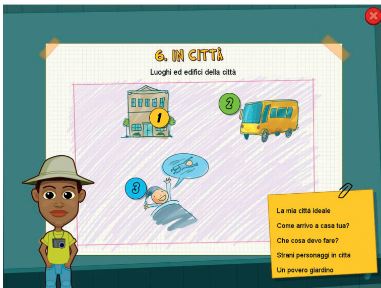
Fig. 9 Il menu della sesta sezione con le iconcine delle 3 unità.