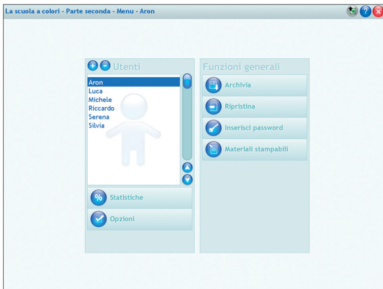
Fig. 13 Il menu del gestionale.

Archivia: questo pulsante permette di fare il backup del database utenti, ovvero di salvare tutti i dati (punteggi, statistiche, personalizzati) relativi agli utenti, nella cartella di installazione del programma (normalmente C:\Programmi\Erickson\).