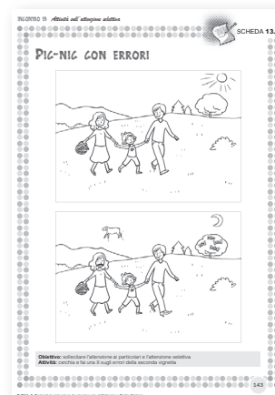
Pic-nic con errori