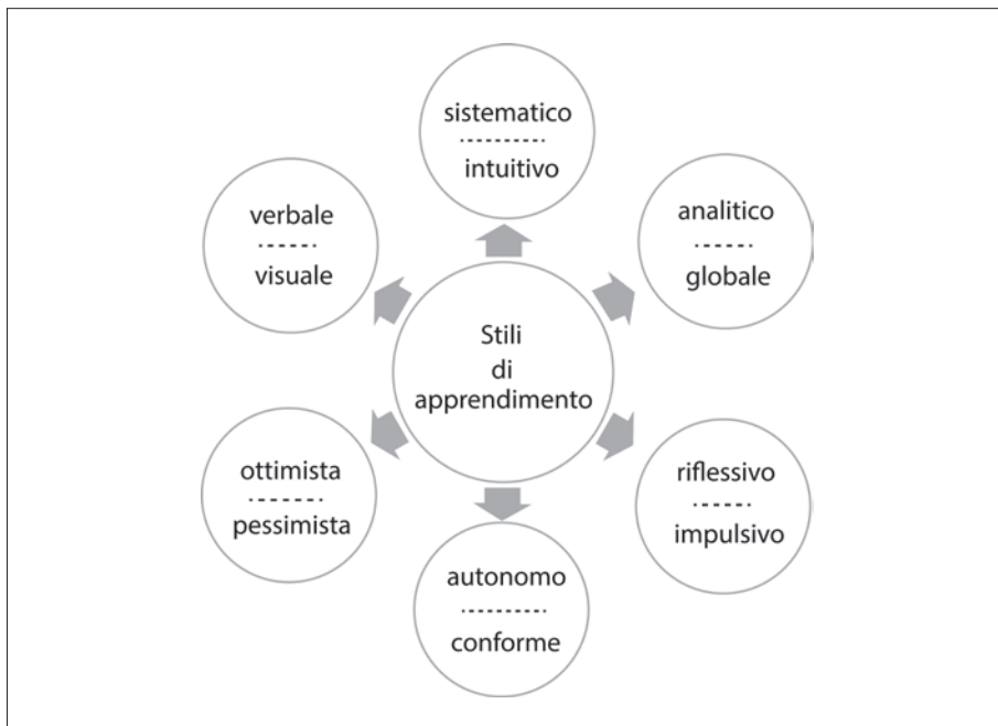
FIG. 3.1 Stili di apprendimento.

Il nostro modo di intendere l'integrazione riguarda anche la prevenzione e l'intervento sul disagio e l'insuccesso scolastico nei disturbi cognitivi, emotivi e relazionali; perciò siamo molto interessati alle relazioni che si stabiliscono all'interno della classe.